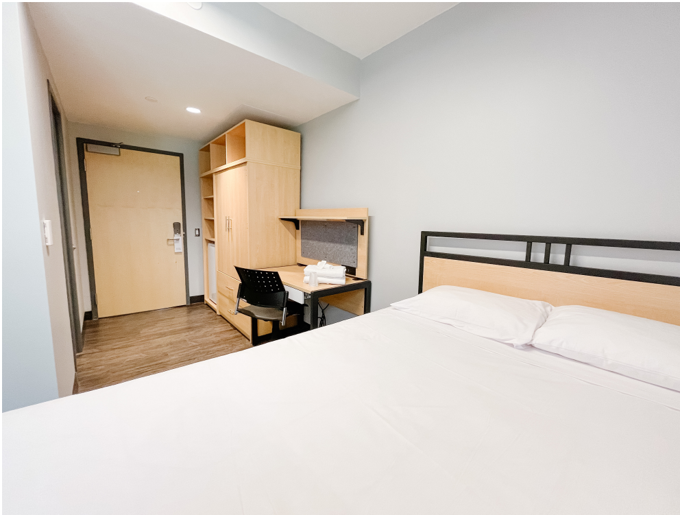
Figure 2: Une chambre à coucher (exemple)