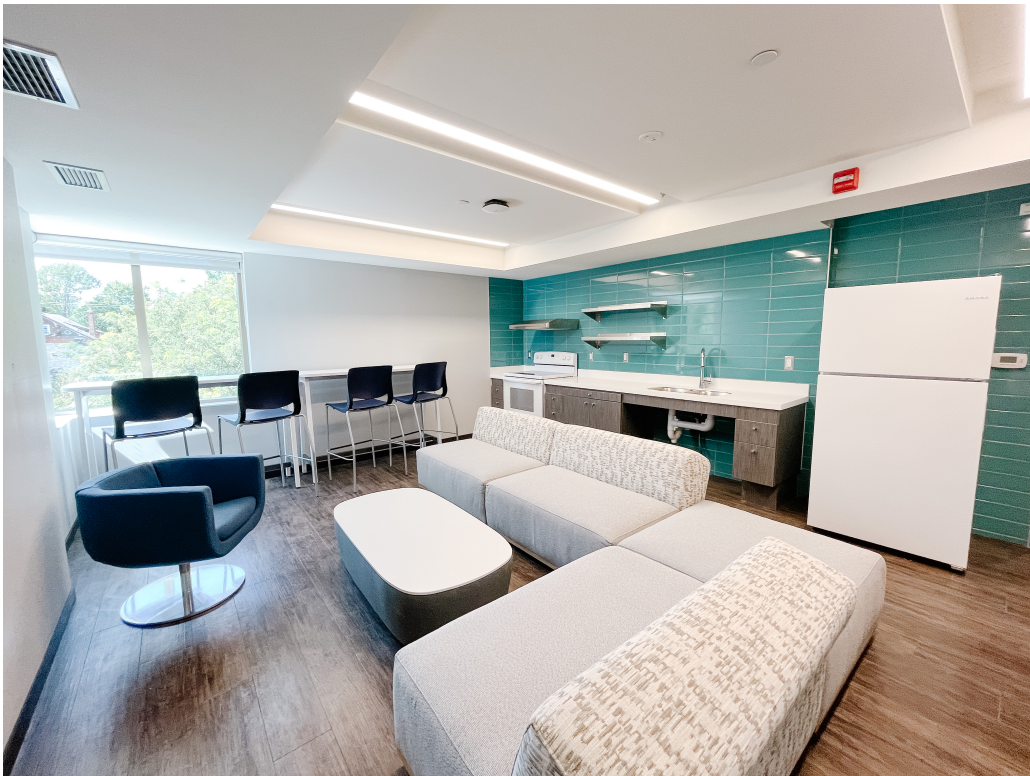
Figure 3: Cuisine commune à l'étage (exemple)